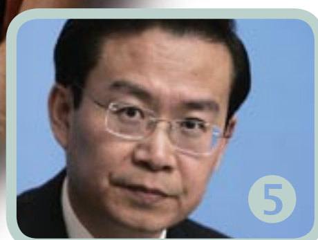
SU SHULIN CHAIRMAN, SINOPEC